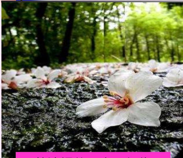
三義油桐花～幸福相約！