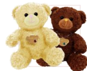
耀鑽寶貝熊 (二色隨機出貨)