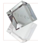
印上捐款人大名 感謝水晶座