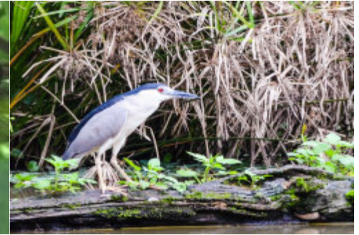
群鳥願意接近人群