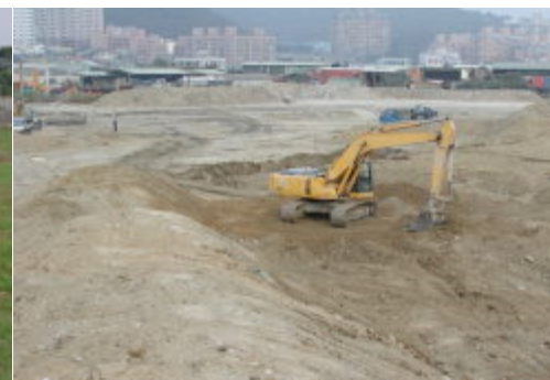
大大小小的機械一鏟一鏟的整地