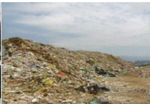
這座垃圾山，曾經傷了五股的心