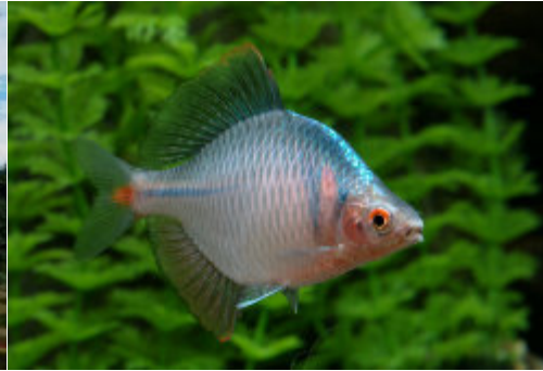
讓在地的物種重回大地