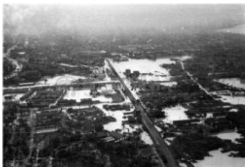
這片藻澤，曾經是五股的痛