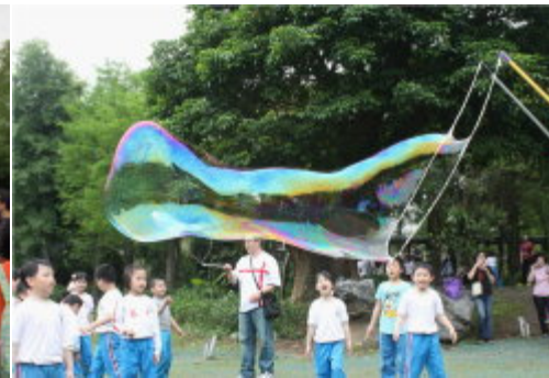
童年有了驚喜記憶