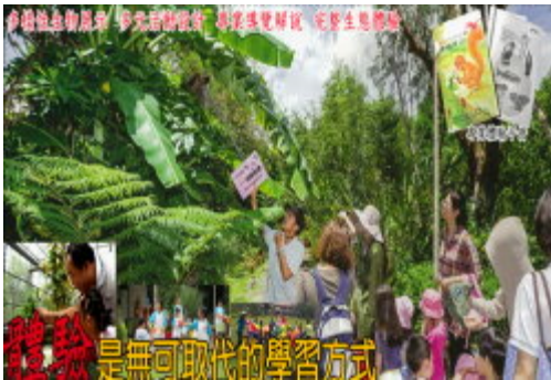
孩子體驗了大自然之美