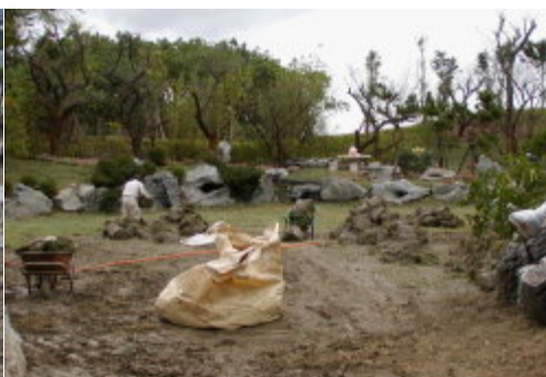
景觀一步一步的鋪陳