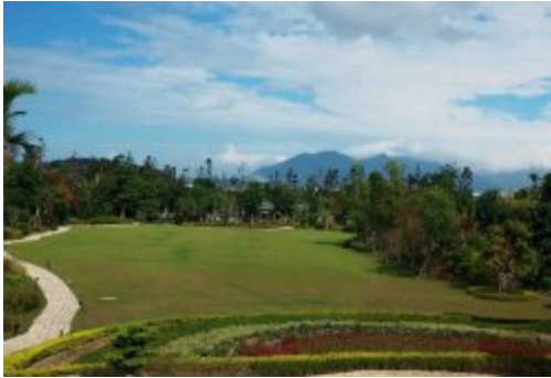
大草原，要收集孩子的笑容