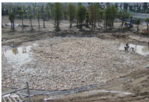
基地一寸一寸的開拓