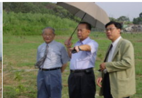
董事長會勘準園用地